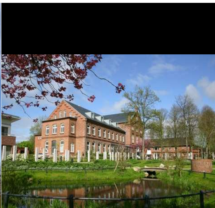
Christian Jensen Kollegiet, Breklum